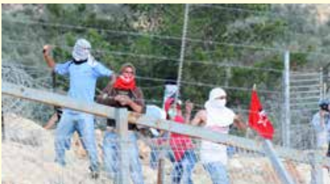
Israel Defense Forces

במהלך השנים נחקרו עשרות רבות של יהודים בשב"כ - איש מהם לא תיאר כאלה עינויים. גם אלו שהודו במעשים שונים ושילמו מחיר אישי וחברתי כבד - לא תיארו כאלה עינויים. גם הנחקרים כעת, בתחילת החקירה לא תיארו בפני השופט את אותה רמת האלימות אלא רק בעיטות. רק לאחר שניתן אישור מיוחד לעינויים, החלו הנחקרים להתלונן על כך בפני בית המשפט. ושוב - אותם תיאורים, מפי נערים שלא פגשו זה את זה!